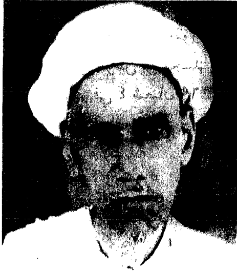
صورة المؤلف رحمه الله